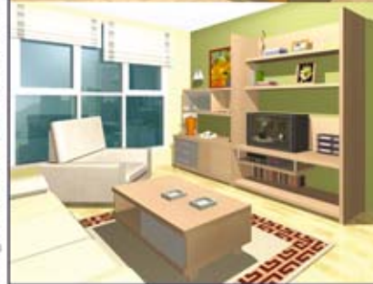
Imágenes obtenidas con Deco Design + Deco Render